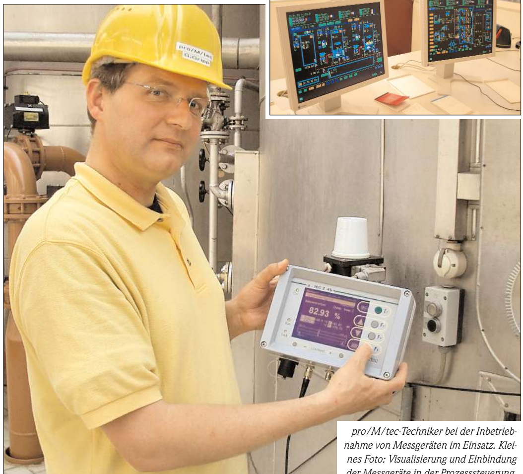
pro/M/tec-Techniker bei der Inbetriebnahme von Messgeräten im Einsatz. Kleines Foto: Visualisierung und Einbindung der Messgeräte in der Prozesssteuerung.

lösen. So kam pro/M/tec ins Spiel. Beginnend 1996 wurde in diversen Felderproben der Nachweis