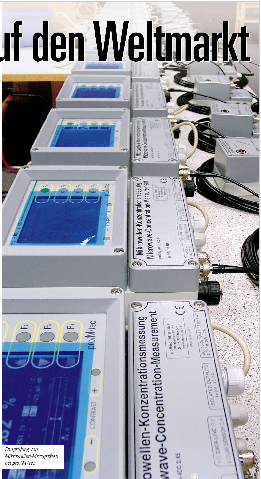
Endprüfung von Mikrowellen-Messgeräten bei pro/M/tec